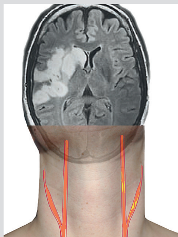
Akuter Schlaganfall eines Patienten aufgrund einer signifikanten Carotisstenose li.